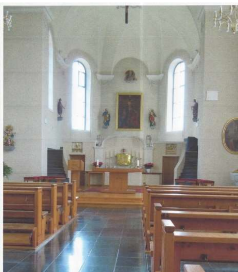
Abb. 4: Blick in die Drei-Königs- Kirche von Balgach

Der kundige Reiseführer wusste zu berichten, dass die Balgacher Gläubigen bis ins 16. Jahrhundert zur Pfarrei Marbach gehörten, was für den sonntäglichen Kirchenbesuch einen weiten Weg bedeutete. Erst 1521 wurde nach vieljährigen Bemühungen das Ziel einer eigenen Pfarrei erreicht. Danach folgten im 16. Jahrhundert die Reformationswirren. Erst 1825 bis 1826 konnte die heutige Barockkirche nach Plänen des Simon Moosbrugger aus der berühmten Architektenfamilie vom Bregenzerwald in Fronarbeit errichtet werden. 1952 bis 1953 wurde das Gotteshaus einer umfassenden Renovation unterzogen, in deren Verlauf auch neue, mit