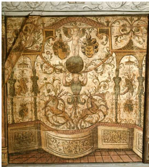
Abb. 3: 1596 liess Junker David Zollikofer im Dachgeschoss einen Festsaal mit Illusionsmalereien der Renaissance einrichten.

Das alte Rathaus war für die Spurensucher die erste Station auf ihrer Rundfahrt durch Balgach. Über die Bedeutung dieses gediegen renovierten Gebäudes hatten sie sich schon vor dem Start zu ihrer Reise in die Ostschweiz auf der Homepage der Gemeinde Balgach informiert: „Das hochaufragende massiv gemauerte Gebäude im alten Dorfteil war mittelalterliches Zehntenhaus. 1594 kaufte es der St. Galler Tuchhandelsherr David Zollikofer. Das oberste Stockwerk liess er 1596 zu einem prächtigen Festsaal mit einmaliger Aussicht ausgestalten. Die grotesken Illusionsmalereien an den Bohlenwänden sind nahezu vollständig erhalten, einzigartig in der Schweiz und somit ein Kulturgut von nationaler Bedeutung. 1969 wurde das Gebäude restauriert, unter Denkmalschutz gestellt und der Öffentlichkeit zugänglich gemacht“. Wie das Ge-