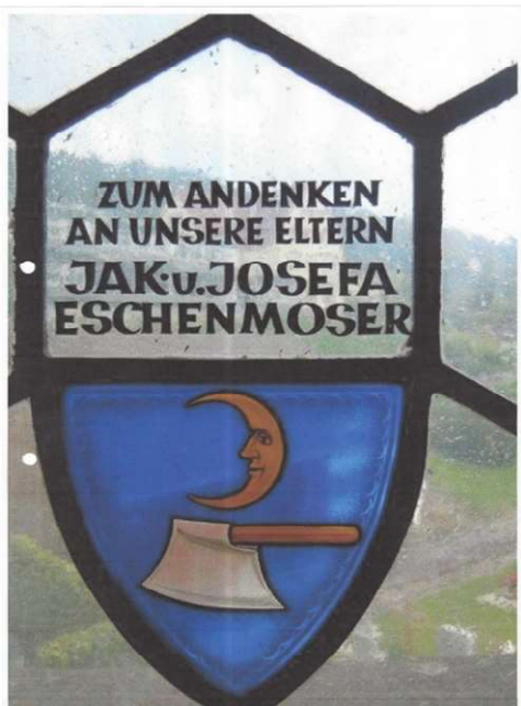
Abb. 1: Inschrift in einem der Glasfenster der Katholischen Kirche Balgach

Nachfahren einer Familie Eschenmoser von Balgach SG auf der Spurensuche nach ihren Ahnen